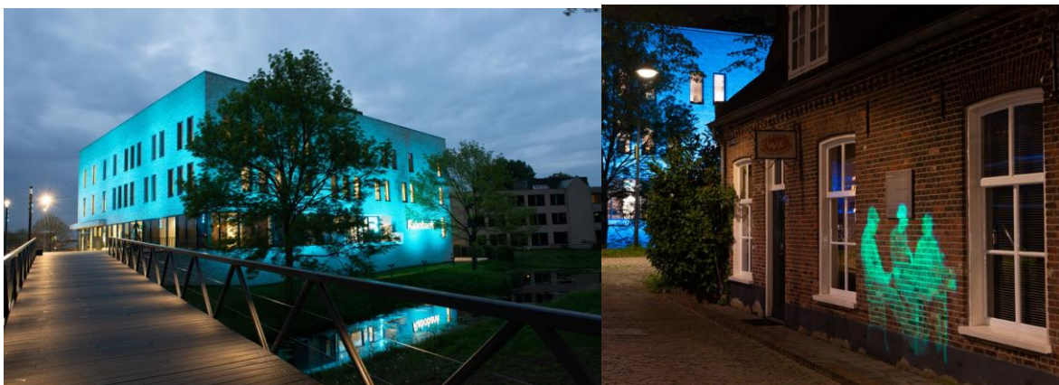
Wet blue, de kleur van met chroom geloid leer, diende als leidraad voor een verlichtingsconcept voor 'leerstad' Waalwijk