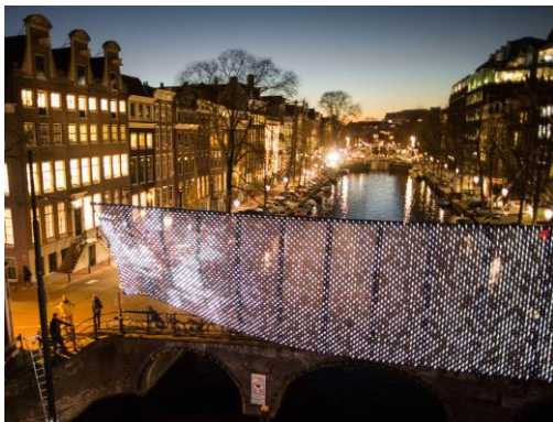
Lightwaves in Amsterdam (2016)

In 2015 hebben Bentham Crowel Architects en Jólán van der Wiel Forces for Architecture opgericht. Dit is een laboratorium dat onderzoekt hoe natuurlijke verschijnselen (zoals wind, zwaartekracht, zonlicht, water en temperatuur) toegepast kunnen worden om de gebouwde omgeving te dienen. Forces for Architecture laat zien dat natuurlijke fenomenen kunnen worden gebruikt om nieuwe soorten architectuur te ontwikkelen. Verschillende experimenten zijn uitgevoerd, resulterend in conceptuele modellen en materialen die reageren op natuurlijke krachten. Joost Vos woont zelf in Hilversum.