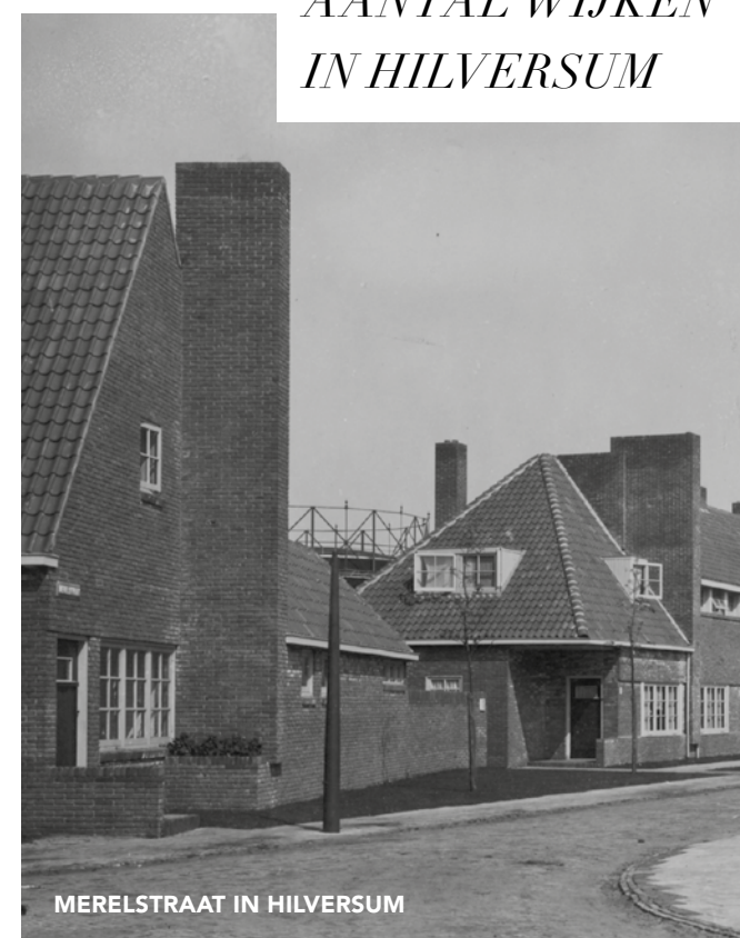
MERELSTRAAT IN HILVERSUM