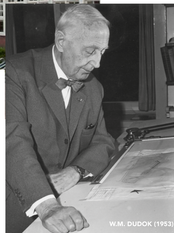
W.M. DUDOK (1953)

DUDOK ONTWIERP EEN GROOT AANTAL WIJKEN IN HILVERSUM