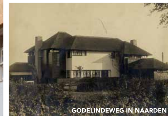
GODELINDEWEG IN NAARDEN

DUDOK ONTWIERP EEN GROOT AANTAL WIJKEN IN HILVERSUM